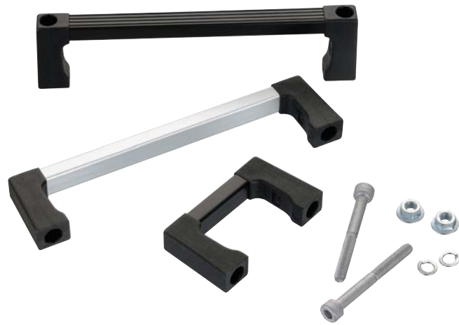
E-40 板外固定式(附配件包) E-40 Outside stationary type (Included accessories)